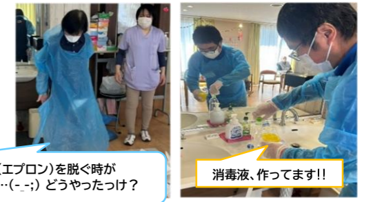
ガウン(エプロン)を脱ぐ時が 難しい…(-_-;) どうやったっけ?

なかなか着る機会がない(ない方がいいですが…)ガウン(エプロン)を 脱ぐときに、体験されたスタッフは戸惑っておられました。 思わず外側(汚染面)を触って脱いでしまう場面も! 「感染してしまってます!」と注意もあり…。 今後も安心して利用者様に生活していただけるよう、 また、安心してスタッフが業務を 行うことが出来るよう研修を開催していきます👍